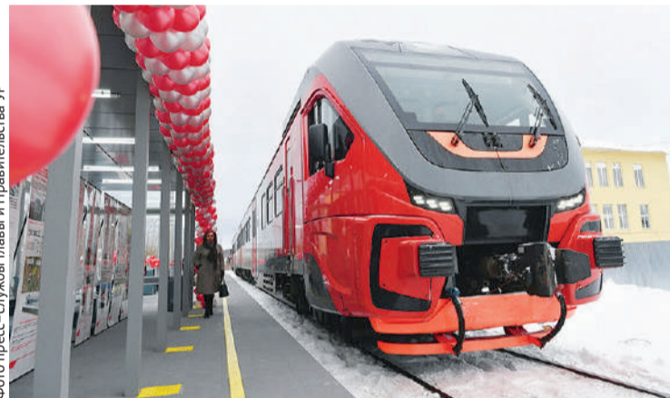
Новый остановочный пункт «Лесозаводская» в Ижевске.

На новой пассажирской платформе «Лесозаводская» будут останавливаться поезда пригородного сообщения Ижевск–Глазов, Ижевск–Ува, Ижевск–Балезино и Ижевск–Игра. Ижевчане просили об этом с 2015 года. Решение о строительстве было принято в марте этого года на рабочей встрече генерального директора – председателя правления ОАО «РЖД» Олега БЕЛОЗЕРОВА и Главы Удмуртской Республики Александра БРЕЧАЛОВА .