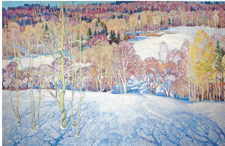
«Конец зимы». Холст, масло, 1971.

Не меньше на его мироощущение повлияли любовь к классической музыке и поэзии: «Мне кажется, что музыка, поэзия и живопись неразрывны. Признаюсь, знаю больше стихов, чем среднестатистический человек, и всегда, как только я начинаю писать, из памяти как будто само собой приходит какое-то стихотворение, в котором выражается то же настроение, какое я создаю на картине. Например, когда я писал «Пейзаж с рябиной», у меня в голове звучал Николай Рубцов. А когда работал над «Концом зимы», был охвачен энергией строк Есенина «Я по первому снегу