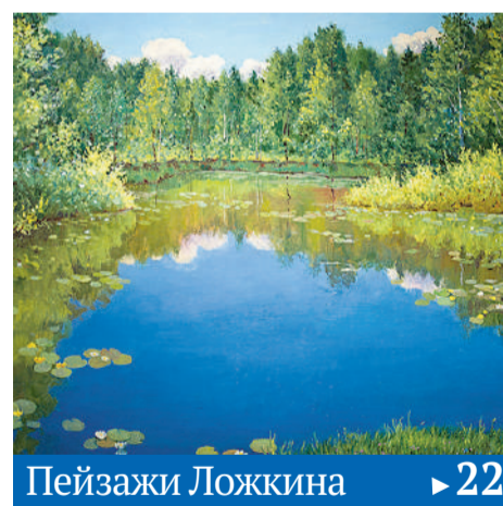
Пейзажи Ложкина ▶ 22

Какие турпродукты Удмуртии увидим в ближайшем будущем. ▶ 21