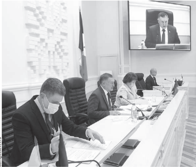
Рассмотрение в первом чтении бюджета республики на ближайшие три года стало ключевым пунктом работы парламентариев на очередной 36-й сессии Госсвета УР.

На обязательное медицинское страхование неработающего населения республики в 2022 году средства предусмотрены в полном объёме в сумме 7,6 млрд рублей.