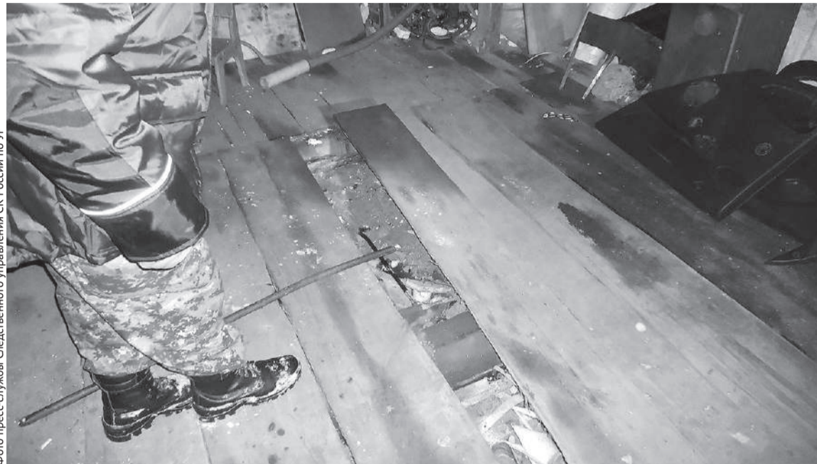
Следователи обнаружили под половицами в гараже знакомых обвиняемого гвоздоёр, которым была убита одна из жертв.

Согласно документам, представленным сотовым оператором, последний звонок с телефона пропавшей был сделан в службу такси в ночь с 24 на 25 ноября. Таксист рассказал следователю, что он доставил пассажирку к дому на улице Клубной, где её ожидал мужчина на автомобиле «Лада-Гранта». Разговариваясь, он видел, как девушка о чём-то быстро переговорила с водителем и села в машину. Внешность её спутника и номер автомобиля водитель не запомнил, как и не смог разглядеть в темноте, был ли в автомобиле кто-то ещё.