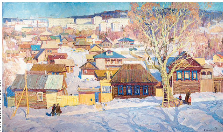
«Окраины Ижевска». Холст, масло, 1967.

бреду, в сердце ландыши вспыхнувших сил... Так и хочется к сердцу прижать обнажённые груди берёз». Живопись Ложкина в самом деле поэтична и музыкальна. Энергичными аккордами ложатся тени от деревьев в том же «Конце зимы», прихотливой аранжировкой клубятся оттенки розового, сиреневого, охристого в ветвях дальнего леса, широкой и уверенной основной темой симфонии лежат синеватые снега. Он часто выбирает такой ракурс, как будто видит панораму сверху (кроме «Конца зимы» так и «Юный май», «Весенний пейзаж с рекой», да и многие работы) – будто и в самом деле взлетает над землёй от восторга.