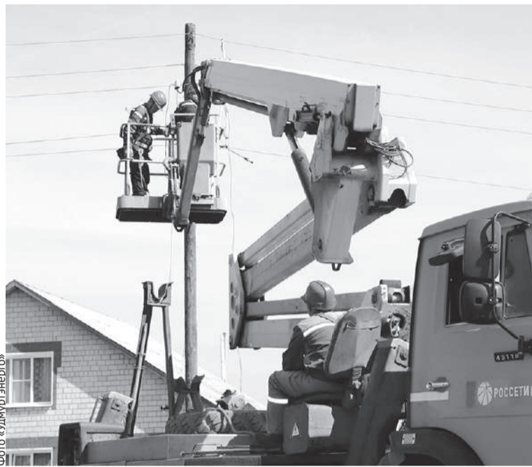
Интеллектуальные приборы учёта устанавливают на границе балансовой принадлежности – на линиях электропередачи, чтобы у потребителя не было соблазна вмешаться в его работу.

– В первую очередь в том, что потребителю не нужно ежемесячно снимать и передавать показания приборов учёта, они снимаются дистанционно. Вы можете уехать в отпуск, перебраться жить к родственникам и не беспокоиться о том, что не смогли вовремя пере-