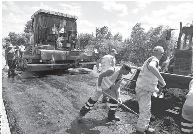
В этом году в рамках нацпроекта в республике привели в нормативное состояние свыше 139 км региональных и межмуниципальных дорог, а также участков улично-дорожной сети.

На многих объектах проводился комплексный ремонт – обновляли не только проезжую часть дорог, но и пешеходную сеть. В 2021 году в республике было построено и отремонтировано рекордное количество тротуаров – более 34 км, оборудовано более 40 дорожных неровностей, установлено два участка наружного освещения на трассах Ижевск – Глазов (поворот на Базелино) и Каракулино – Красный Бор, а также 30 камер фото- и видеонаблюдения. Благодаря этому в Удмуртии доля дорог, нахо-