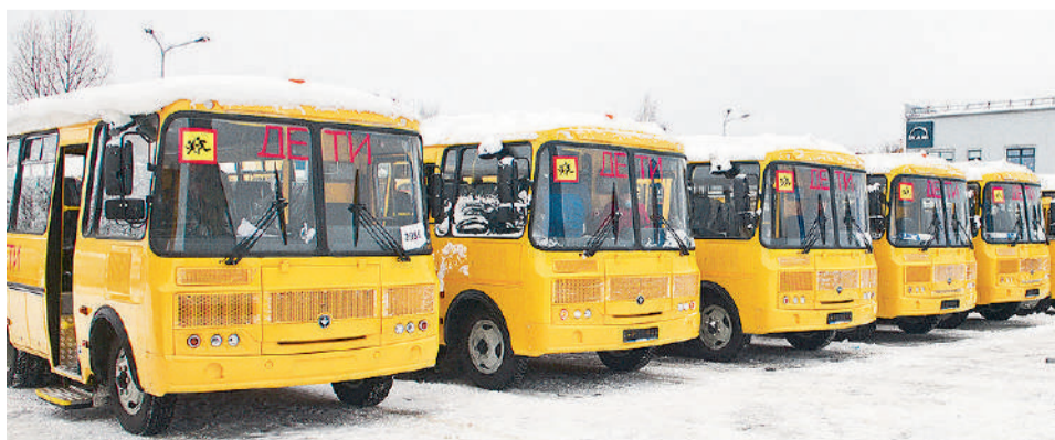
110 автобусов для школьников Удмуртии ▶ 4